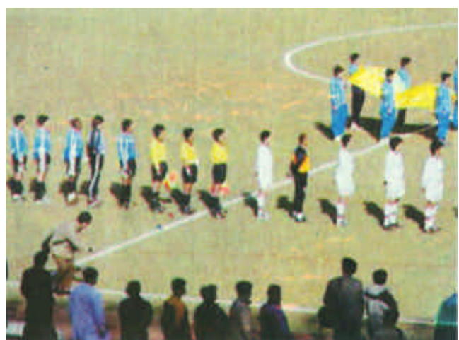
甲A第二轮波导大战实录

新华社汉城3月17日电 (记者 张利) 据汉城媒体报道，预计世界杯期间将有4万中国球迷来汉城，因此已经确定了700多家民居供他们住宿，这些住户都能够说汉语。 此外，汉城市将为外国球迷在南露营地和汉城大公园搭建能够容纳1400人的住宿设施，计划人均收费标准为10美元。外国人住民居收费为每天30美元，自助游的游客喜欢住的旅馆收费标准为每天20美元。