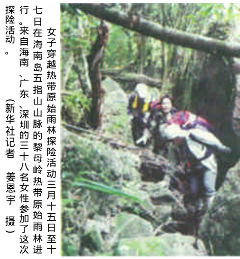
七日在海南五指山五指山山脉的黎母岭热带原始雨林中进行。来自海南（左）深埋的三十八名女性参加了这次探险活动。

2002年3月20日 星期三 第29期 总第2664期 全国统一刊号：CN37-0054 邮发代号：23-172