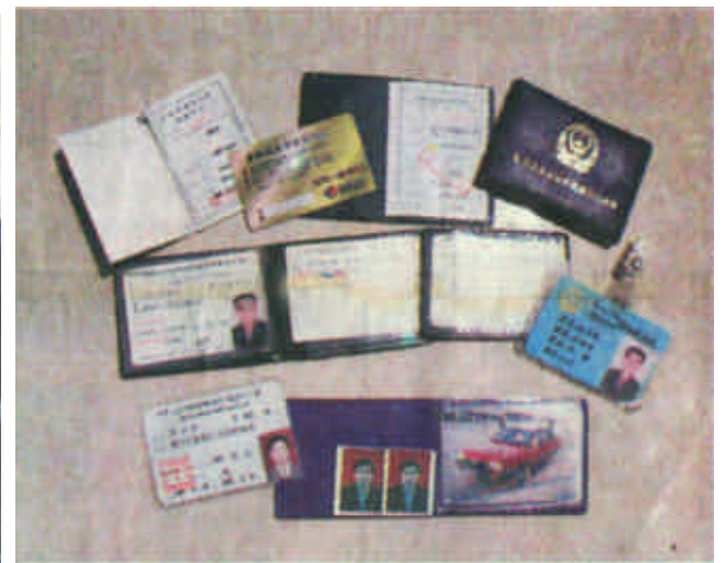
从车上搜出的部分犯罪证据。