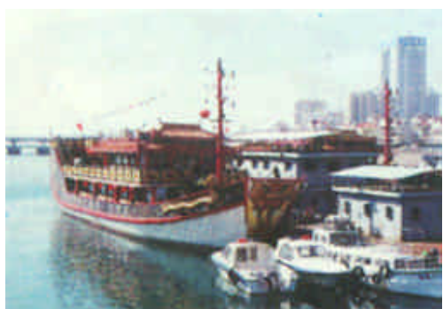
来自大连的两艘仿古游船“大福龙”号和“大福凤”号日前驶临青岛。这两艘游船是大连一家海上旅游公司建造的，该公司看中青岛大有潜力的海上旅游市场，因而把这两艘游船从大连“移师”青岛。图为停泊在码头的“大福龙”号（左一）